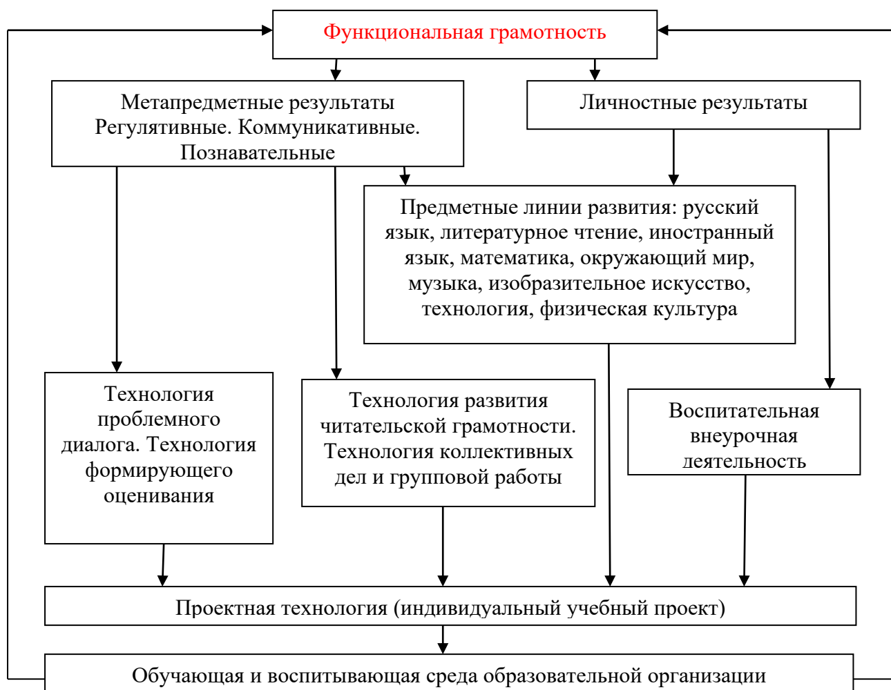
Схема «Система работы школы по обеспечению личностных и метапредметных (УУД) результатов школьников»