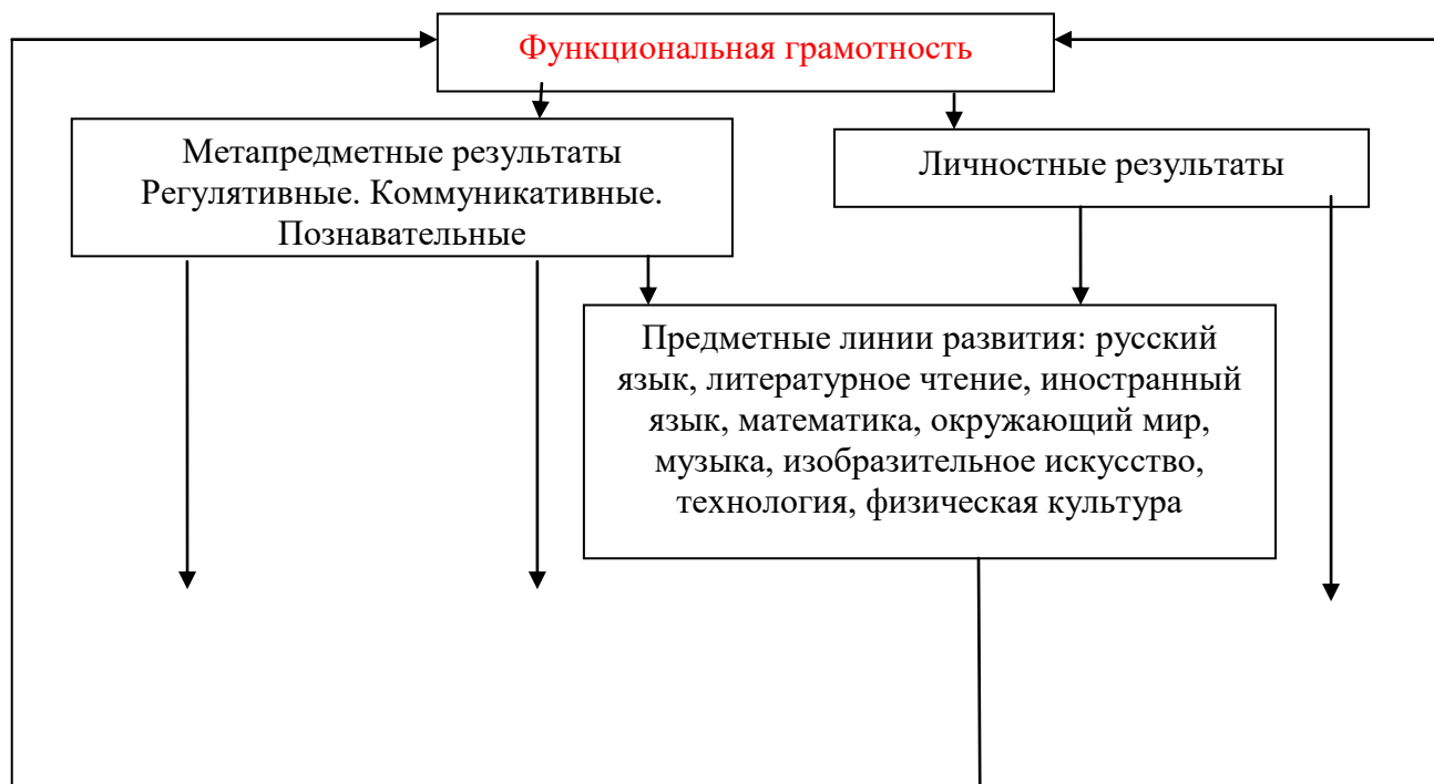
Схема «Система работы школы по обеспечению личностных и метапредметных (УУД) результатов школьников»